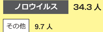
食中毒1件あたりの患者数

※出典：食中毒統計（平成28～令和2年の平均。病因物質が判明している食中毒に限る）